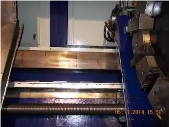
P46) O óleo foi mais, o mais desgaste do revestimento deslizante saiu porque correu secar um longo período de tempo.