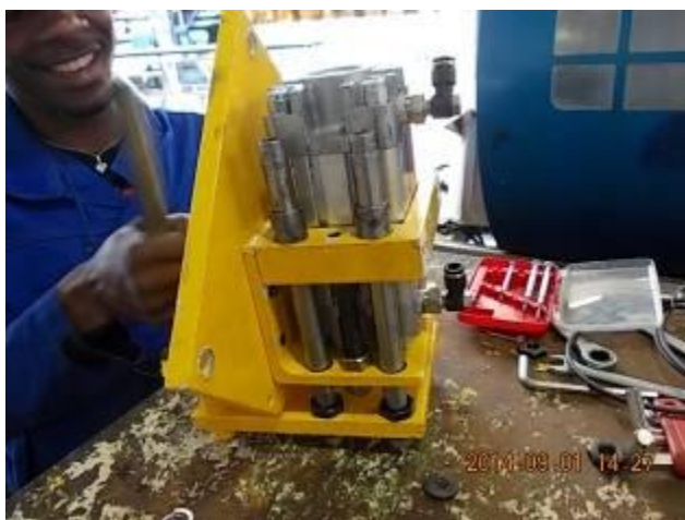
P36) do cilindro de freio. O cilindro é usado como um padrão. ,