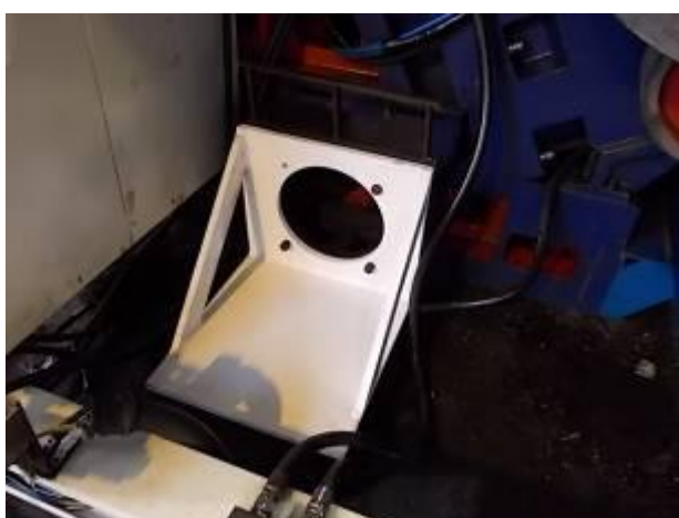
P14) Uma vez que o novo motor é um pé do motor, tivemos que fazer um buraco quadro permanente. Nós instalamos o mesmo motor em todas as máquinas. Assim, o estoque de peças sobressalentes é mais fácil.