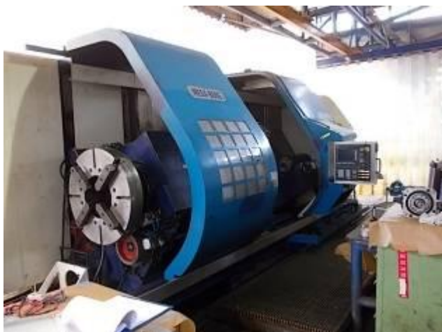
P19) A máquina mega Bore pesa mais de 20 toneladas