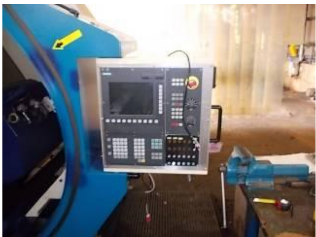
P32) Em breve, tornar o primeiro teste com 24 volts externos.