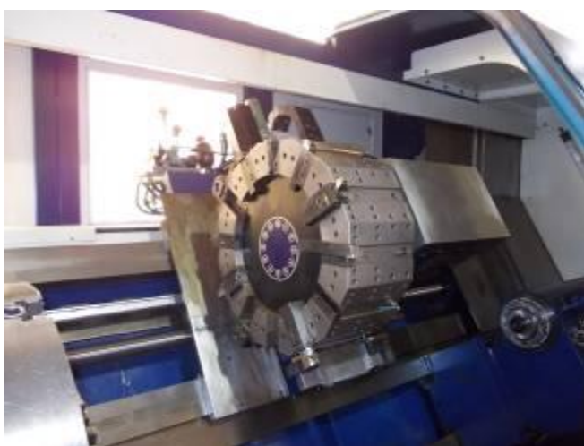
P31) Uma foto da torre da máquina sem cobertura. É uma torreta Baruffaldi italiano.