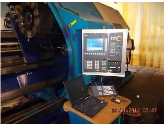
P48) O Torno CNC mega Bore recém-renovado está em produção.