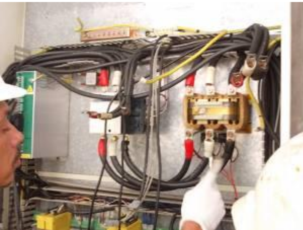
Cabos P7) grossas estão em uso aqui. O mais grossa é de 80 mm / 2.