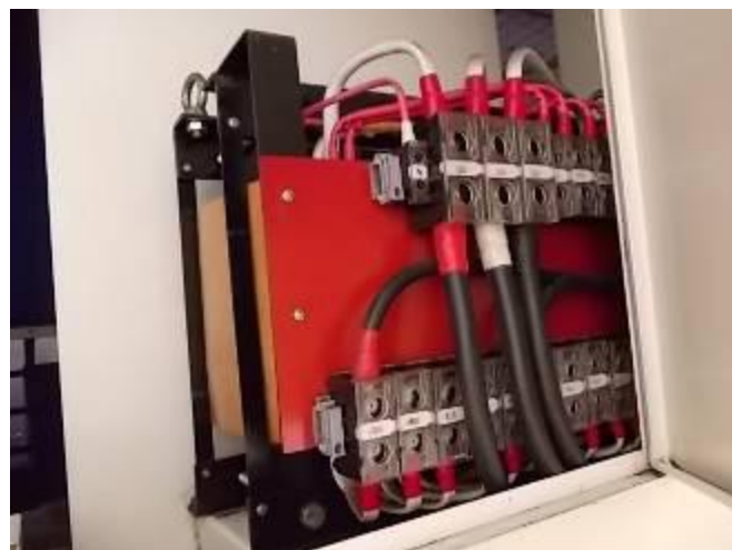
P23) Um grande transformador que reduz os 230/400 volts para 115/220 volts.