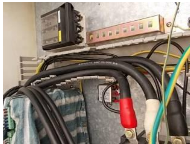
P21) Aqui nós fazemos o Anderst sistema de segurança, mais salvaguardas. Sem fios finos e grossos sem proteção.