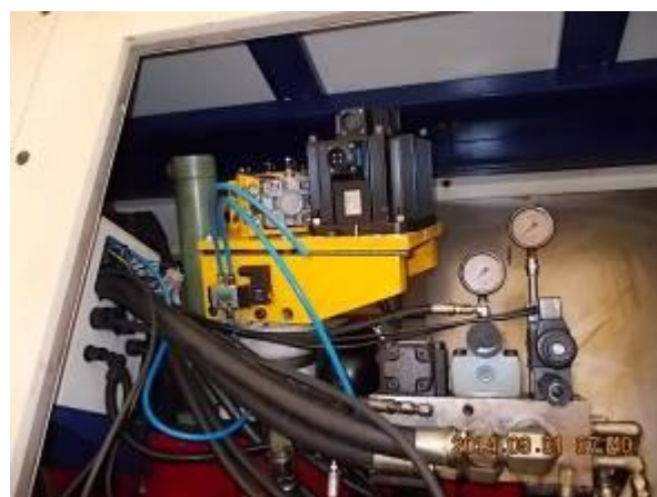
P35) O projeto do motor inteiro 1: 3 atarracado. Um cinto, H300, a 70 mm de largura, então provavelmente não ocorre a ruptura da correia.