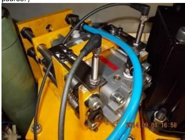
P37) Robust construção de freio, proprietária. Freou com switch e irrestrita. Definir para que seja detectada uma pressão inferior a 3 bar.