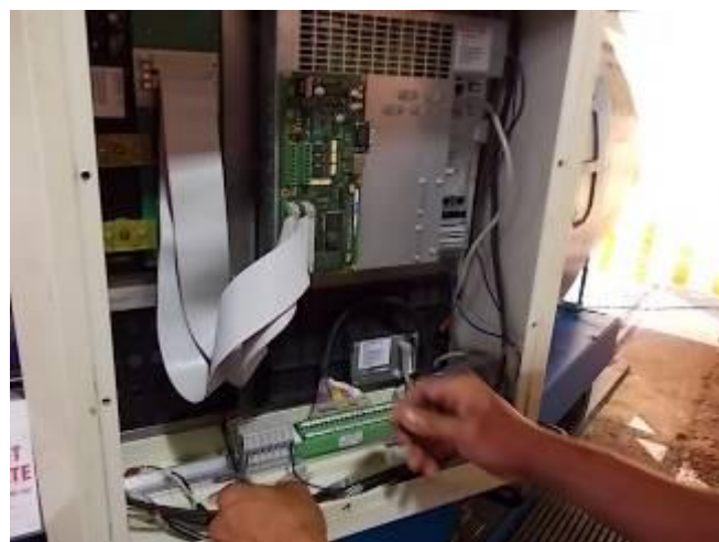
P29) O fato é que há um número significativamente menor de cabos que pendem por lá. Certamente apenas 30%. Optical e muito mais agradável de usar.