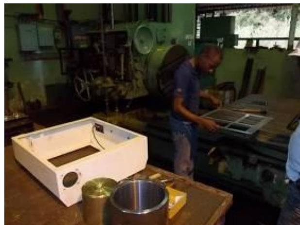
P15) remodelação Panel em preparação