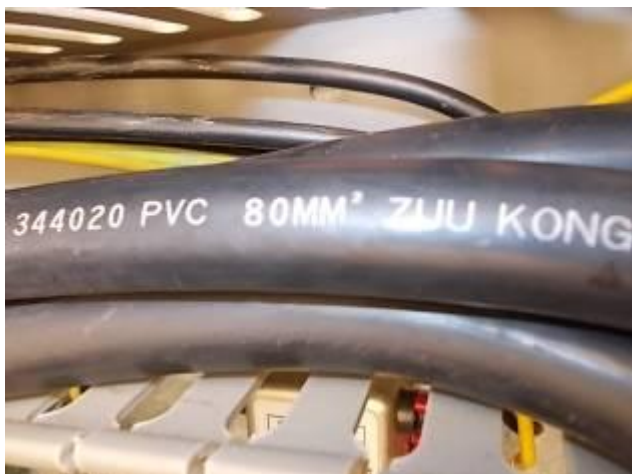
P20) Uma vez que existem cabos com 80 mm / 2. Uma vez que o motor é operado no país de origem 115/220 volts, esta cabos grossos foram instalados.