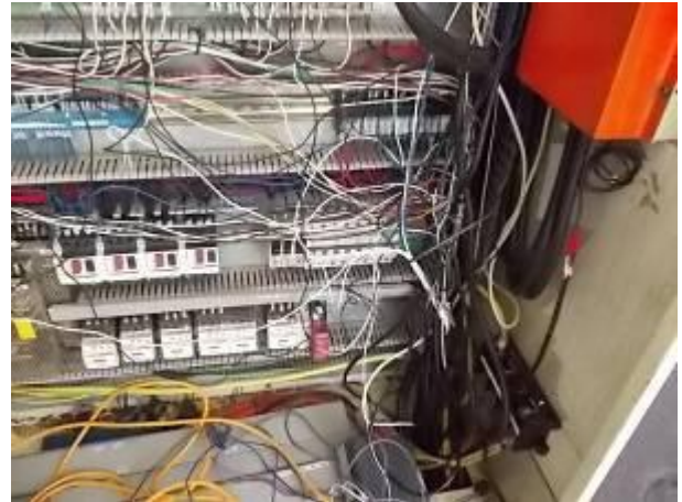
P9) redes mistas e cabo. Surpreendentemente, o fabricante tem a cabeça 0, assim como o poder, feita para o 220 volts com várias cores. Cabos foram muito curto, foram estendidos com cabos de cores diferentes. Alguns no canal a cabo foram soldadas juntos!