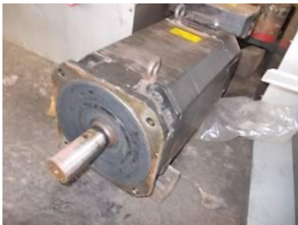
P12) O motor spindle Fanuc vê em Angola depois de um curto período de uso, muito maltratado. O clima é muito stron aqui. Os impulsores desmoronar na regra.