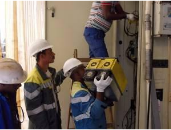
P6) expansão da Fanuc