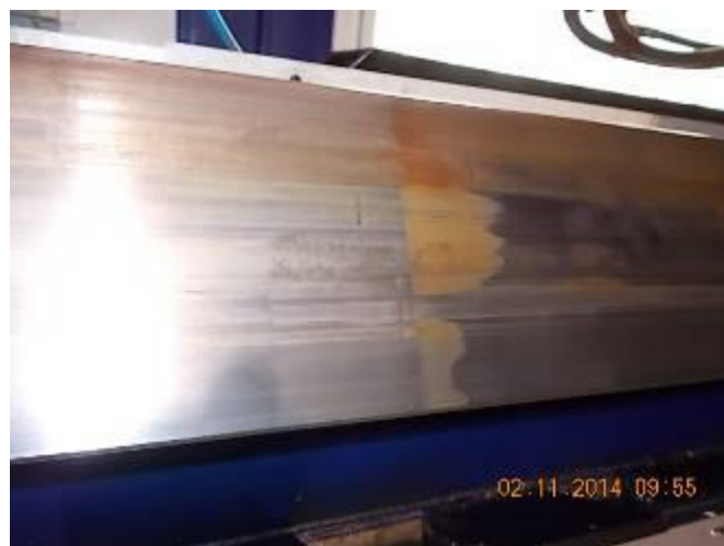
P39) A máquina tem uma lubrificação deficiente. Só quando o petróleo chegou, o marrom deslizamento abrasão revestimento apareceu.