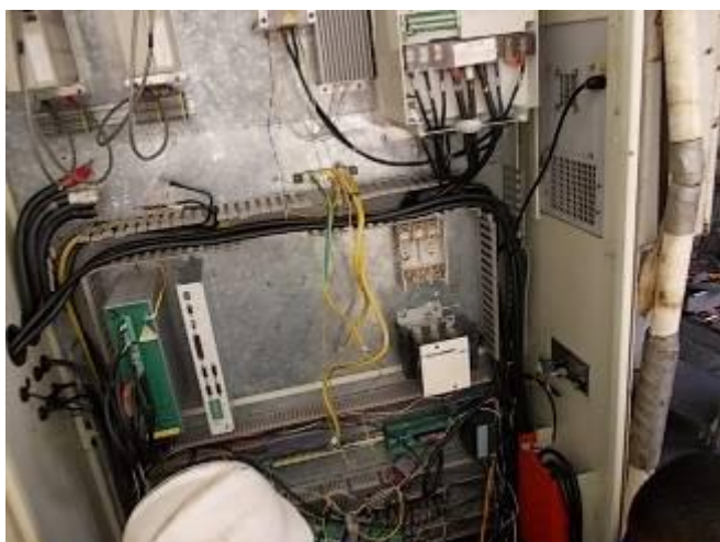
P25) Logo, instalado tudo bem e ainda tem um pouco de cargo vago.