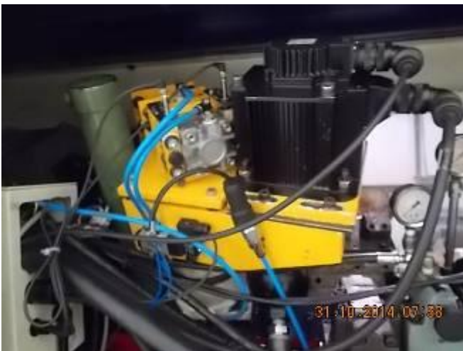
P47) sistema de travagem New X