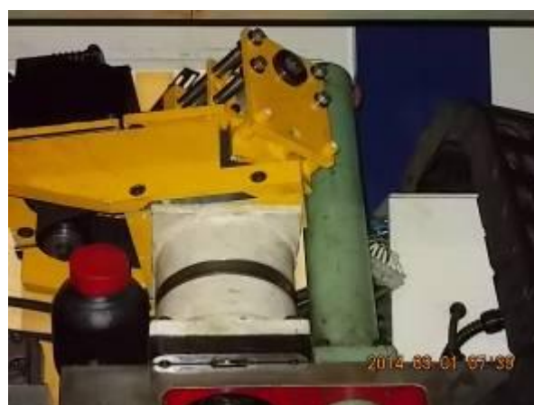
P34) O motor X com o novo freio. O travão tem sido feita de modo que os mesmos motores de alimentação pode ser usado.