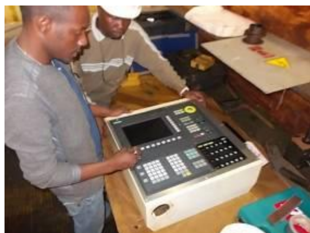
P16) Yoba constrói o Sinumerik 802. A placa frontal é feito de aço inoxidável. Os meninos percebem que tocar em aço inoxidável é persistente.