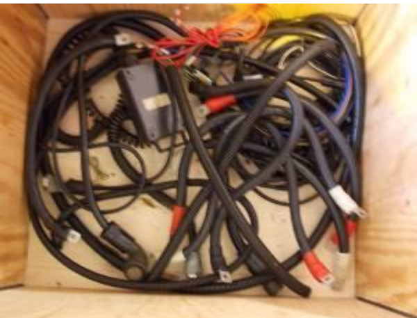
P8) cabo Convertido