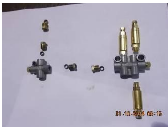
P41) tag Lubrificação. O parafuso de bola recebe um duplo quantidade de óleo.