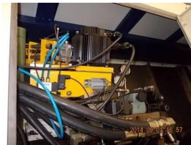
P38) Pouco espaço para a colocação no 60 ° cama inclinada Torno CNC arranjo.