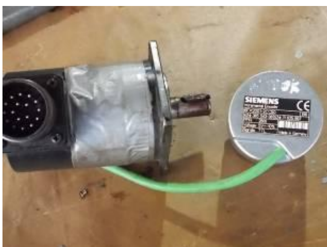
P26) O velho encoder Fanuc (à esquerda) está saindo. Um novo (à direita) está montado.