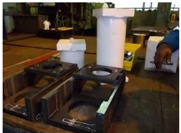
P17) Aqui é o de bens requeridos pelo novo motor. Uma vez que os motores têm os mesmos em todas as máquinas, que tem uma proporção de 1: 3 marca.