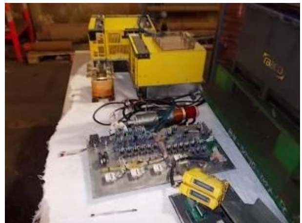
P10) convertido controle de material Fanuc 18i.