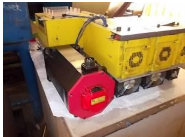
P11) A Z-motora. O motor X tem um freio. Há 7 motores de alimentação KW.