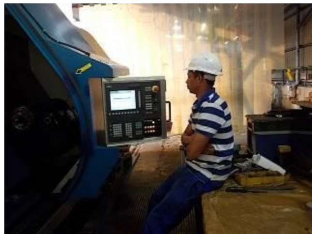
P33) E já Carlo tem o CNC off: Todos nós temos 110 volts no painel e tem apenas 24 volts. Isto tem a vantagem de que ninguém deve esperar um choque elétrico.