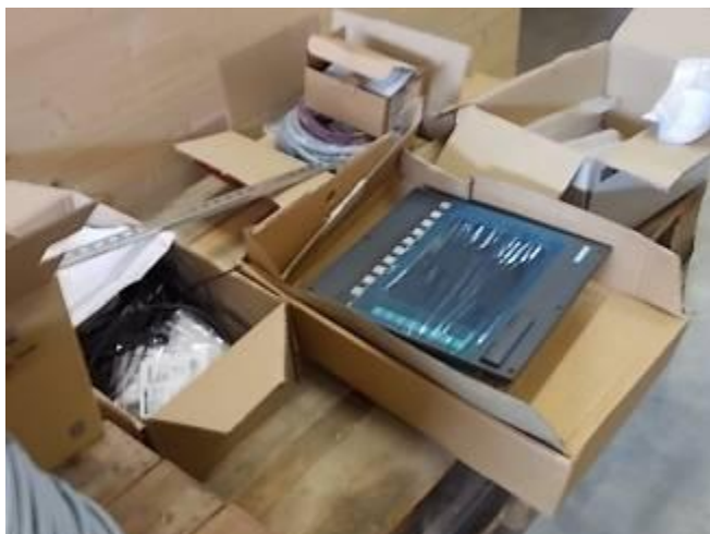
P30) O material de conversão necessário foi disponibilizado na Suíça e nos chega via DHL.