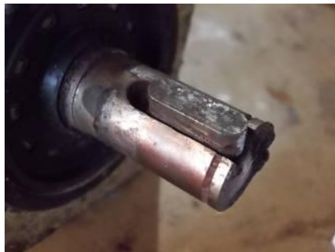
P27) O codificador Fanuc tem muito de se preocupar porque ele é montado sem Achsfluchtfehler embreagem. Então, como vamos fazê-lo com os doadores que construímos na Siemens CNC.