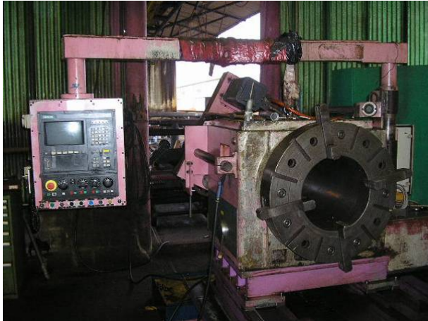
Photo 1: Maschine läuft seit einigen Tagen nicht mehr. Spindelantrieb geht nicht. Def. Entscheid sofort die CNC ersetzen.