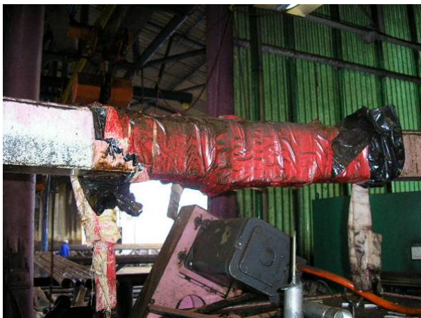
Photo 2: Hier hat man verhindert, dass Wasser in die CNC läuft, trotzdem war die immer nass. Es sieht nach grosser Menge Kondenswasser aus. Die Aircon lief immer auf Hochtouren.