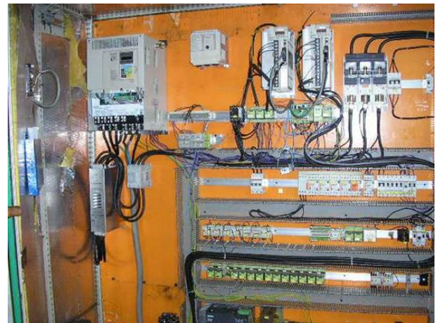
Photo 8: Alles, was Kabel war, weg. (Wir hatten eine Idee, Wireles). Die Fehlerquellen waren zu gross, die Maschine hatte so viel drin wie Messen, Bruchüberwachung Angetrieben Werkzeuge, C Achse. Aber man brauchet es nie. Die Maschine war voll nur mit Rohrdrehen belegt, darum haben wir für den Unterhalt nur noch das Minimum vor drin zu haben.