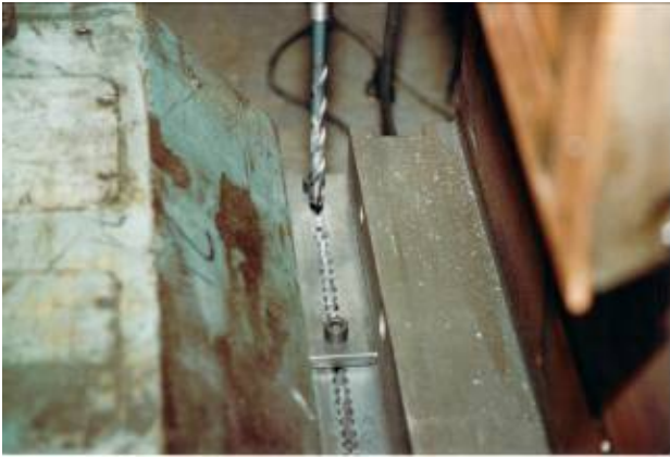
Ende Umbau Retrofit 3. Walzendrehmaschine