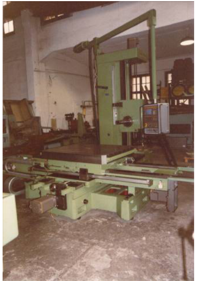
3 lineare Achsen X ,Y und Z und der Rundtisch. Zudem noch eine lineare W Achse in der Ergänzung zur Z Achse. WU5010

Auftragsumfang: Demontage des Zentral Antriebes und Einzel Achs Antrieb. Rundtisch auch CNC gesteuert. Anbau von Kugelrollspindeln in der X,Y und Z Achse und einzelnen Vorschubmotoren. Konstruktion und Herstellung inkl. Montage von Wiap.