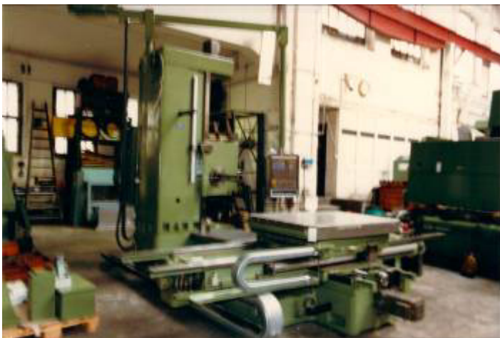
Hier ist die fertige Maschine nach dem Umbau mit der neuen Sinumerik CNC Steuerung. WU5009