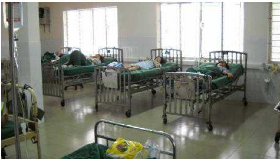
Photo 06: Sehr einfache Betten ca. 0.9 x 2 Meter (oftmals liegen 2 oder 3 Patienten in einem Bett!) Dies ist die Aufwachstation