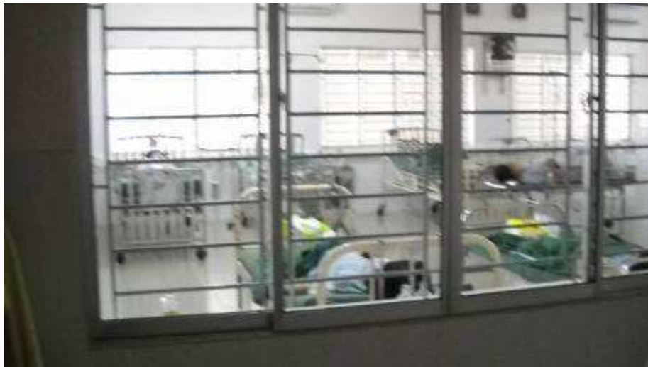
Photo 05: Spital. Viele Betten. Durch das, dass man von 400 auf 800 Betten das Spital erweitert ohne bauliche Massnahmen, sind alle Zimmer überfüllt mit Betten. Medikamente müssen in dem Spital bezahlt werden, nur für ganz Arme hat man Lösungen.