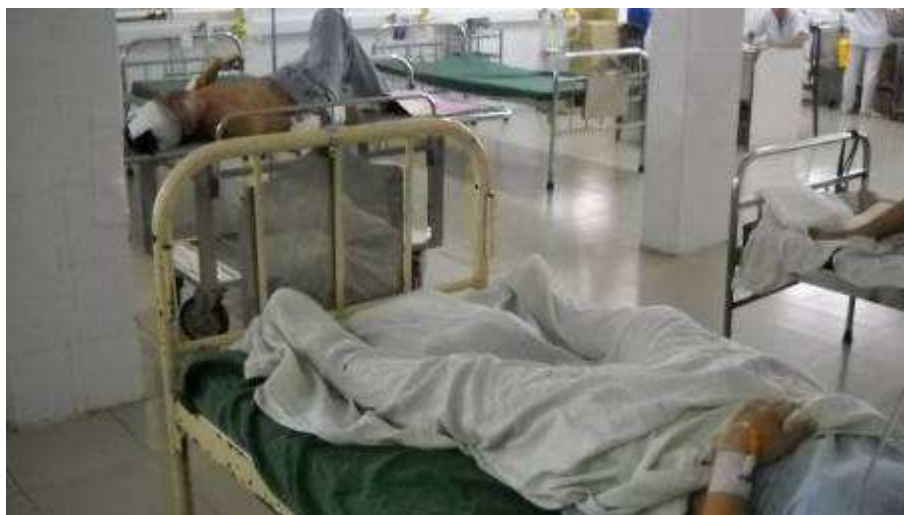
Photo 07: Diese Betten sollten wir wenn möglich, ersetzen. Wenn wir das schaffen, dann haben wir grosse Freude, denn dies ist die Aufwachstation nach Operationen.