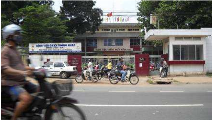
Photo 01. Spital Dong Nai Vietnam Besichtigung 30.08.2010