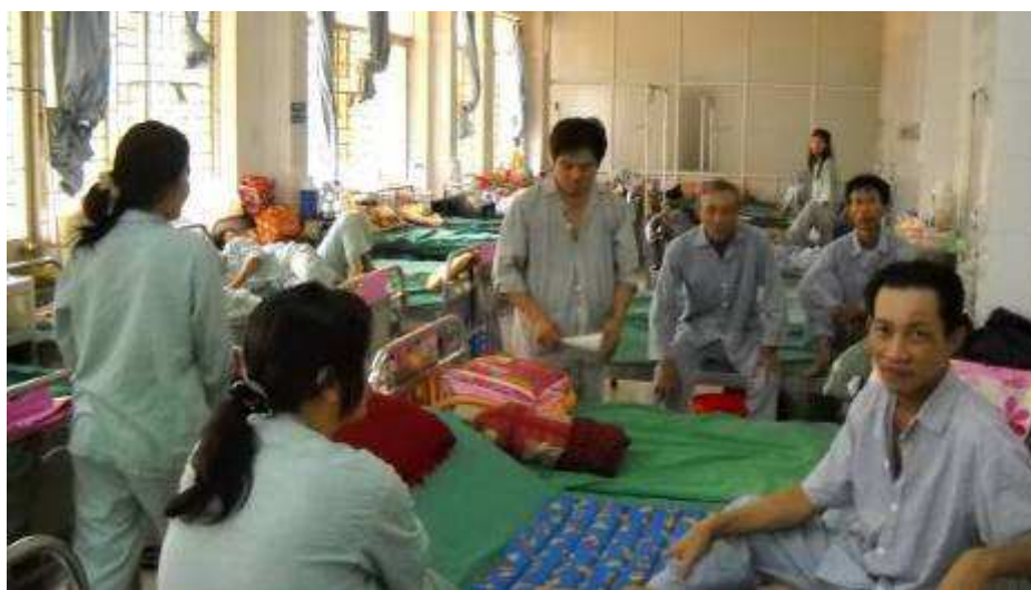
Photo 09. Die Zimmer sind total überfüllt . Dies ist die Unfallstation. In jedem Raum sind Frauen und Männer gemischt. Es gibt keine Unterschiede.