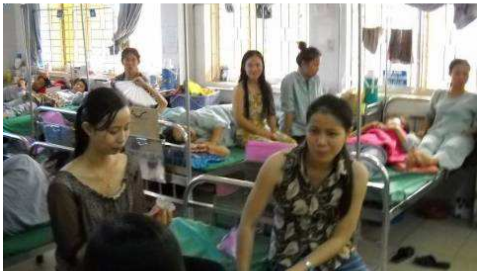
Photo 12: Viele Zimmer sind total überfüllt – nicht nur mit Patienten, sondern auch mit Verwandten, die ihre Angehörigen pflegen und ernähren.