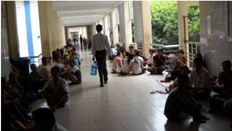
Photo 10: Hier sieht man, wie viele Patienten draussen schlafen. Es sind sehr viele. Von 400 Patienten auf 800 Patienten, das ist nicht einfach, also schläft man auch draussen im Gang.