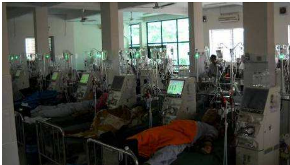
Photo 11: Hier ist die Blutreinigungsabteilung. 10 Geräte gehören dem Spital; 30 sind geleast. Wie können wir da helfen? Im alten Bericht im 2005, waren da nur 10 Geräte, heute sind es 40 Stk. und ein reger Betrieb. Pro Tag gehen 3 Leute an eine Maschinen