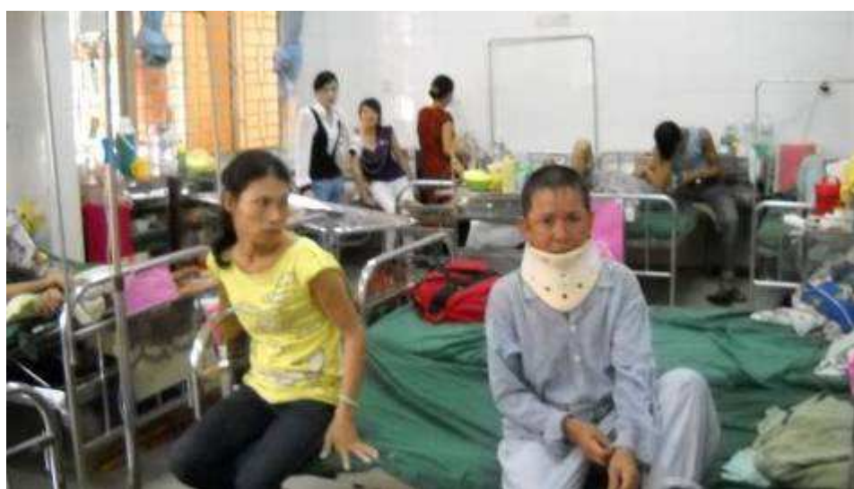
Photo 13: Hier nochmals die Unfallabteilung