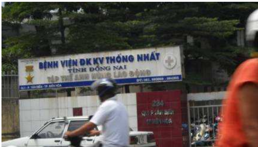
Photo 02: Spital Dong Nai Nachbarprovinz zu Saigon (seit Kriegsende Ho Chi Minh City) genannt. Spital Ansicht von Aussen. Jeden Tag hat man 2000 Behandlungen. Alle Patienten sind arme Leute