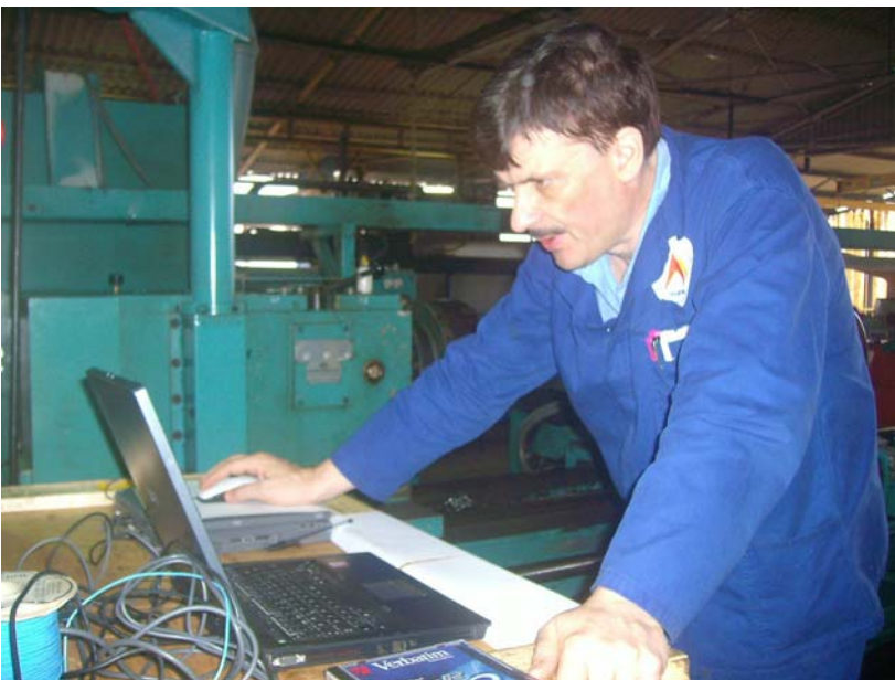
Photo: Es gibt einige Sachen die gehen müssen wie Revolver, Getriebe, dann die Sicherheit ist sehr wichtig.