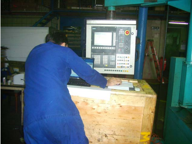
Photo: Hier ist man am PLC programmieren mit dem Lap Top.