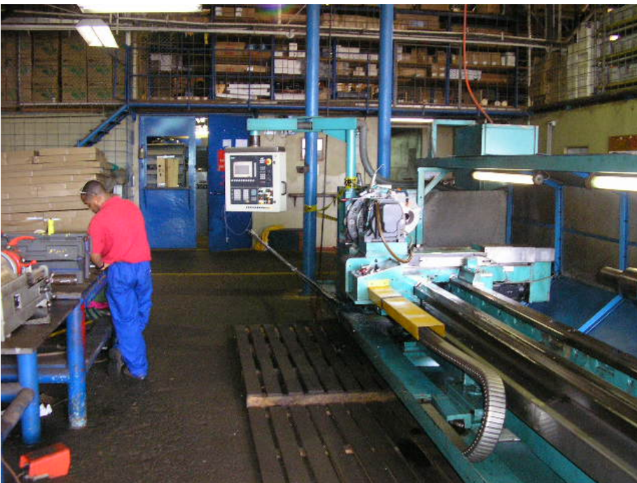
Photo: Hier sieht man nach dem Abschluss des Umbaus wie der Alltag vor sich geht. Jo beim Zeichnungen studieren fürs nächste Projekt.

Photo: Diese Maschine da wo sie steht haben wir oft tropfnass gearbeitet der Schweiss lief einem aus den Poren wie verrückt. Die Luftfeuchtigkeit ist oft über 100 %. Wenn man Durchzug machte hatte man zu starken Zug dann wieder Ohrenschmerzen also nicht einfach als Euromensch da in Afrika mit dem Leben zurecht zu kommen.